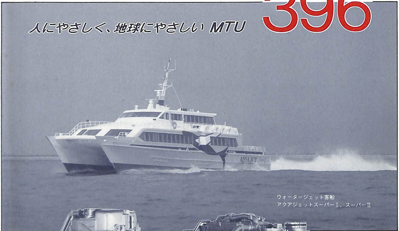
ウォータージェット客船 アクアジェットスーパー I、スーパー II